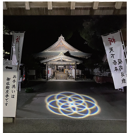
実施/パイフोटニクス株式会社

境内の神門、拝殿、御神木、史料館、倉庫をライトアップし、いつもと違う表情を見せます。各日記念特別行事を開催予定。